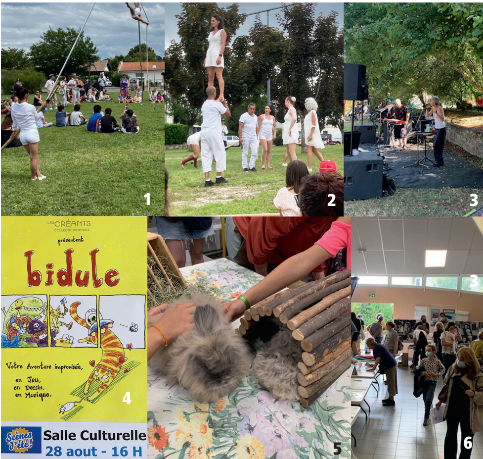
1 et 2 - Balade Circassienne / 3 - Ouvre la Voix / 4 - Spectacle Bidule 5 - Les animaux à la bibliothèque / 6 - Forum des associations