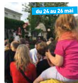
Fête du village « La San Pimpine »