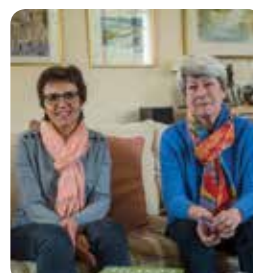
Cénac/Portumna : ligne directe