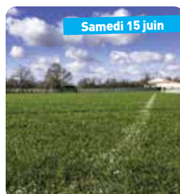
Inauguration Plaine des Sports et Salle Multi-Activités