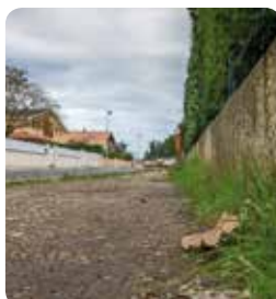
Collectivité publique et pesticides