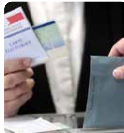
Inscription listes électorales